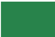
RAL 6032 - Signal Green