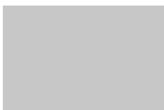
RAL 7047 - Light Grey