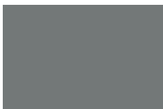
RAL 7037 - Dusty Grey